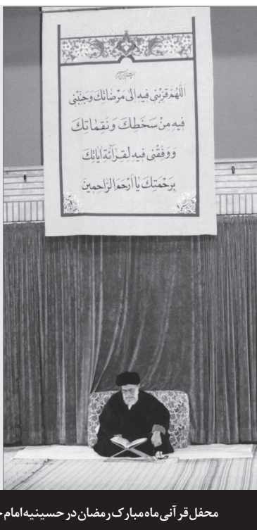
محفل قرآنی ماه مبارک رمضان در حسینیه امام خمینی (ره) در دهه هفتاد

قرآن، هم کتاب علم و معرفت است یعنی دل را و اندیشه‌ی انسانی را سیراب می‌کند - قرآن برای آن کسانی که اهل معرفت‌آموزی هستند یک سرچشمه‌ی تمام‌نشدنی است - لکن علاوه بر اینها قرآن دستور زندگی هم هست؛ قرآن علاوه بر جنبه‌ی معرفتی و معرفت‌آموزی دستورات کاربردی دارد برای زندگی؛ یعنی محیط زندگی را آباد می‌کند، زندگی را از امنیت و سلامت و آسایش برخوردار می‌کند. ● ۹۹/۲/۶